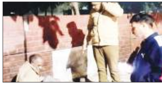
व्यक्ति को इनकी जानकारी मिल सके। रैन बसेरों में गर्म कम्बल, गद्दे, हीटर, पीने का पानी, शौचालय और बिजली जैसी सुविधाएं दी गई हैं। सभी रैन बसेरे अच्छी कंडीशन में रहे, इसके लिए चौकीदार की ड्यूटी भी लगाई गई है। इनकी सफाई-सफाई के लिए एक-एक सफाई कर्मी की ड्यूटी भी लगाई गई है। इन स्थानों पर लगाए बोर्ड-

टीम एक्शन इंडिया/करनाल/राजकुमार प्रिंस। नगर निगम की ओर से शहर के भिन्न-भिन्न क्षेत्रों में बनाए गए रैन बसेरे बेघर लोगों को आश्रय देकर उन्हें कड़कती ठंड से बचा रहे हैं। इनमें एक स्थाई और 5 अस्थायी रैन बसेरे हैं, जिनमें बेसहारा व्यक्ति रात गुजारते हैं। रैन बसेरे किस-किस लोकेशन पर स्थापित हैं, इसके लिए नगर निगम की ओर से शहर की विभिन्न लोकेशन पर फ्लैक्स बोर्ड भी लगाए गए हैं, ताकि बाहर से आए बेघर